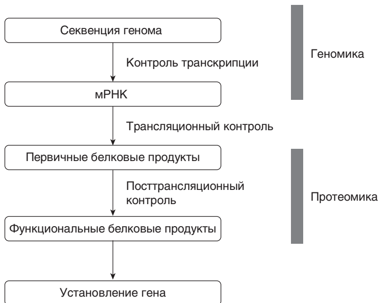
Рис. 2.1. Путь продуцирования белка от экспрессии гена к функциональному белку с помощью контроля

может содержать более 300 000 различных белков (трехмерных структур), каждый из которых выполняет разные функции. Сложность протеома выражена в следующем утверждении: «Даже ограниченные парными мутациями белков, есть десятки миллиардов возможностей». Путь продуцирования белка показан на рис. 2.1.