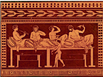
Сисситии в Древней Греции