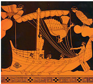
Сирены и Одиссей