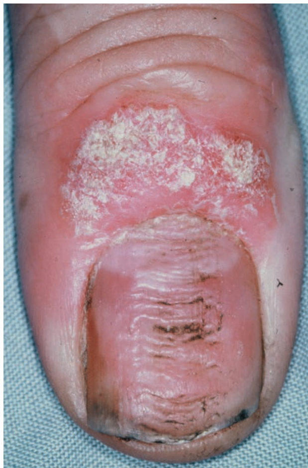
■ Рис. 1-3 Поперечные борозды.

ной лихорадки, а затем описанные Бо [Beau, 1848] [3], появляются в результате того, что временно замедляется скорость формирования ногтевой пластинки. Если формирование ногтя временно останавливается (рис. 1-3), возникает дефект ногтевой пластины, который называют онихомадезисом. Глубокие продольные дефекты, вызванные потерей целостности ногтевой пластины, называются щелями, или трещинами.