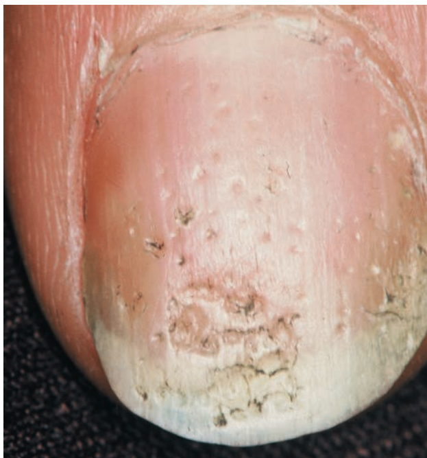
■ Рис. 1-2 Впадины на ногтях.