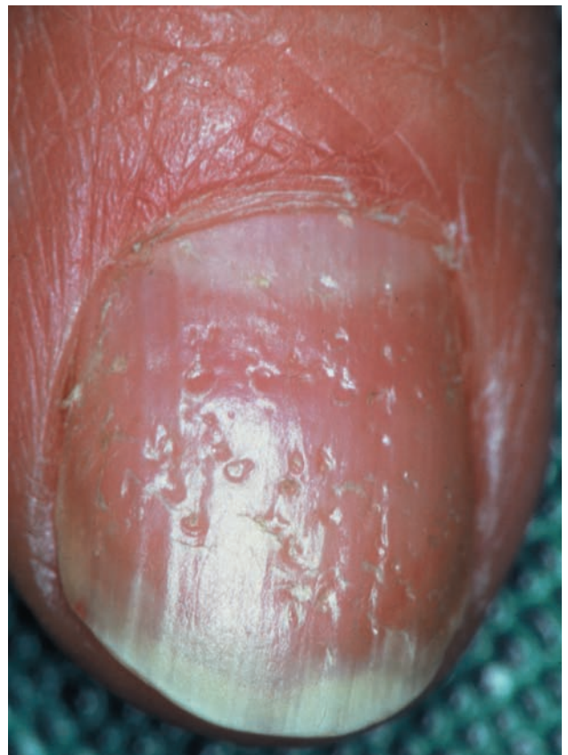
■ Рис. 1-1

может быть признаком псориаза, очаговой алопеции, красного плоского лишая, экземы, атопического дерматита или дефицита иммуноглобулина А (IgA) [2]. Поперечные борозды, впервые описанные Рейлем [Reil, 1797] как возникающие после силь-