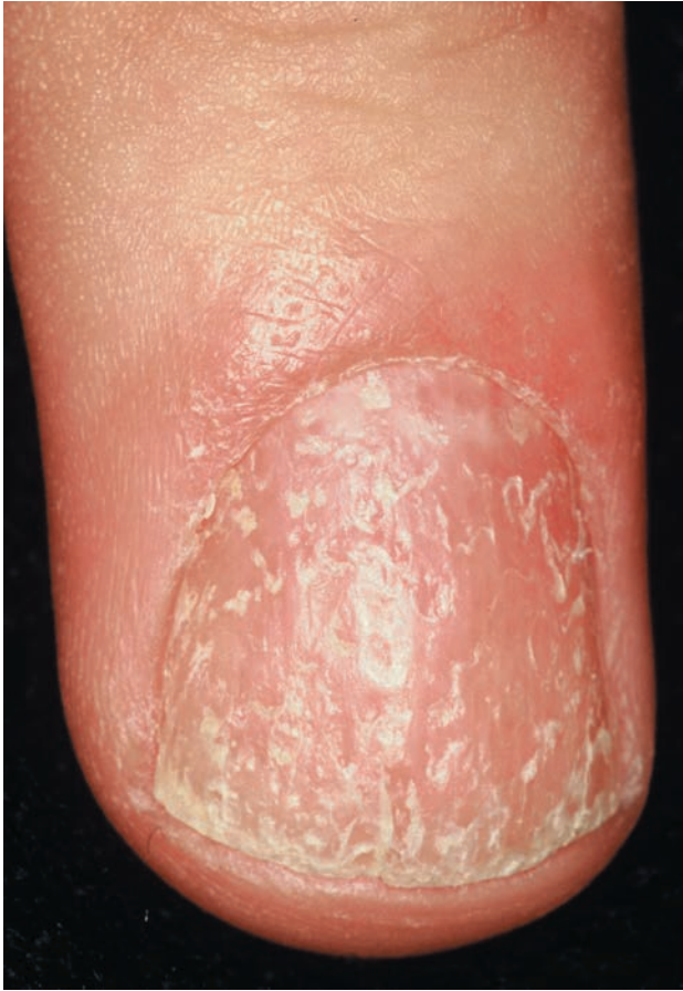
■ Рис. 1-9 Диффузные углубления с паракератотическими клетками.

При этом поражения ногтей обычно начинаются с углублений и симптома масляных пятен. Последние, тем не менее, чаще более коричневатые, чем при классическом псориазе, из-за наличия большего количества экстравазальных эритроцитов [5]. Паронихия может быть первым признаком поражения ногтей (рис. 1-11).