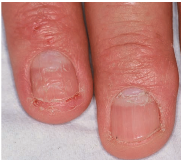
■ Рис. 1-12

Неправильные углубления при контактном дерматите.