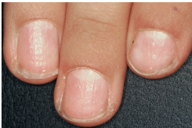
■ Рис. 1-4

Псориазические углубления, поразившие несколько ногтей.