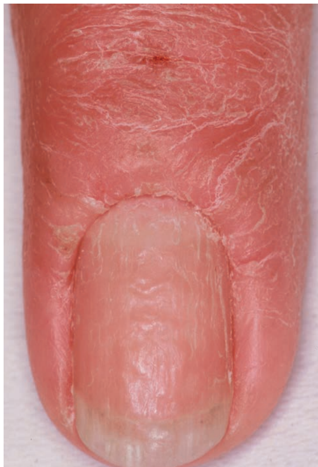
■ Рис. 1-13

Неправильные углубления при контактном дерматите.