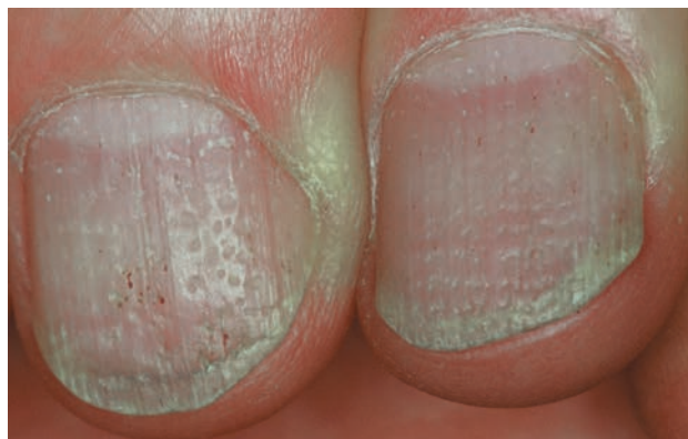
■ Рис. 1-6

Псориазические углубления, поразившие несколько ногтей.