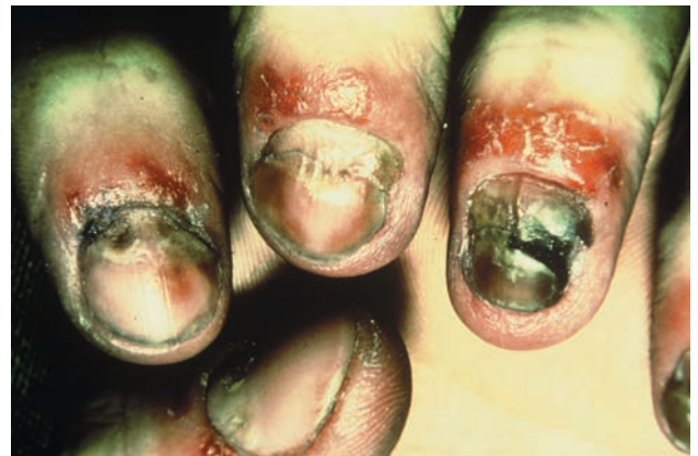
■ Рис. 1-11 Синдром Рейтера с паронихией.