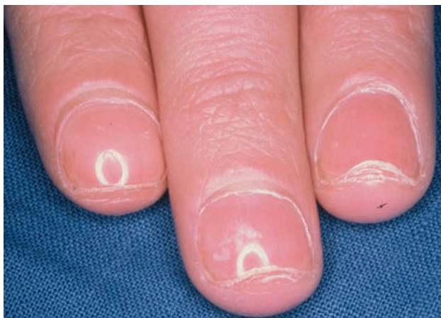
■ Рис. 1-14

Блестящие ногти, обусловленные хроническим зудящим дерматитом.