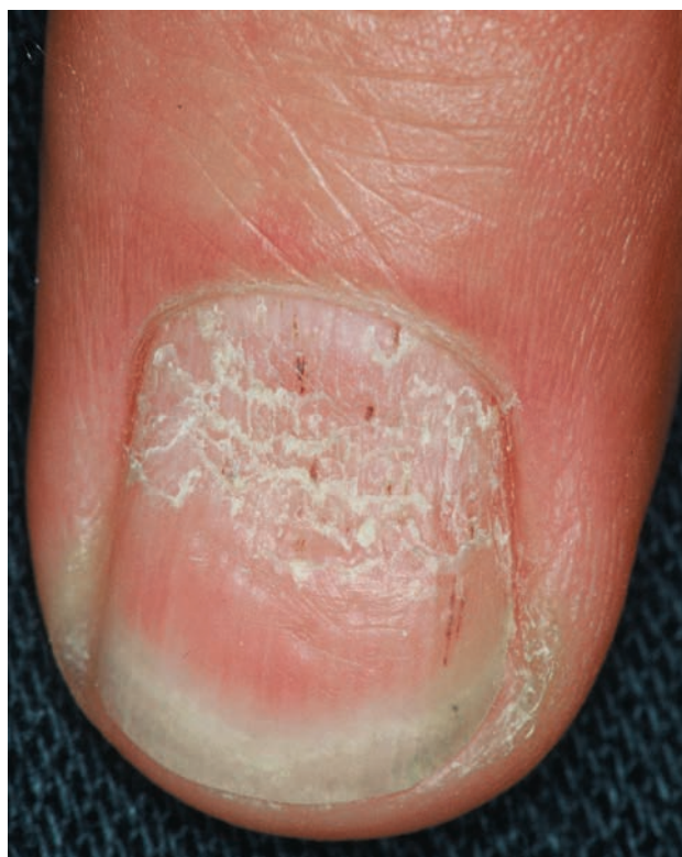
■ Рис. 1-7

Псориазические углубления после лечения антралиномом, которое делает их более заметными.