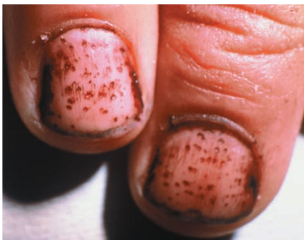
■ Рис. 1-5

Вертикальные углубления на левом псориазическом ногте и горизонтальные углубления на правом ногте.