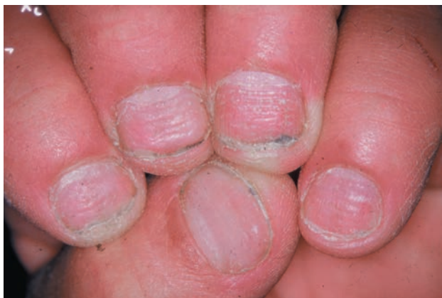
■ Рис. 1-15

Горизонтальные углубления при очаговой алопеции.