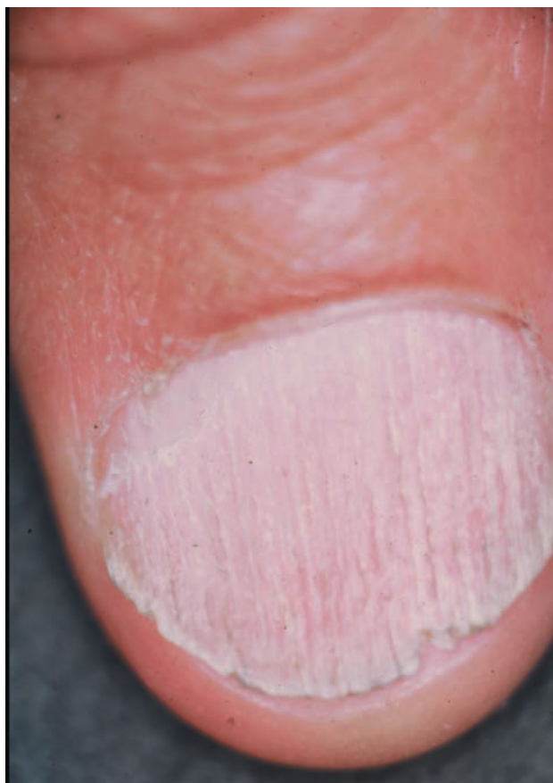
■ Рис. 1-17

проксимальной части матрикса везикулы высыхают в процессе роста, оставляя впадины на поверхности ногтевой пластинки. Когда межклеточный отек более выражен в центральной и дистальной части матрикса, серозный экссудат остается заключенным в ногтевой пластинке, тем самым обуславливая утолщение ногтя, ломкость, мутность и сероватый цвет. Вероятно, главную роль в образовании шероховатой поверхности ногтя играет то, что воспаление и появление серозного экссудата в матриксе вызывают волнистое расположение онихоцитов и их кератиновых волокон, в отличие от нормального линейного расположения.