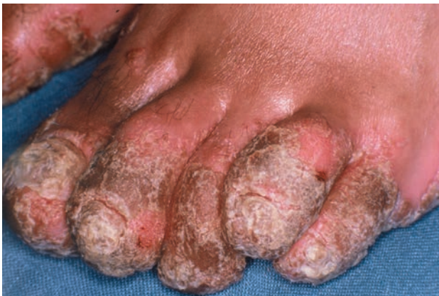
■ Рис. 1-10 Синдром Рейтера.

Полированные ногти ( unguis lucidus ) характерны для пациентов с атопическим дерматитом и другими хроническими зудящими дерматозами: больной расчесывает зудящую кожу дорсальной частью дис-