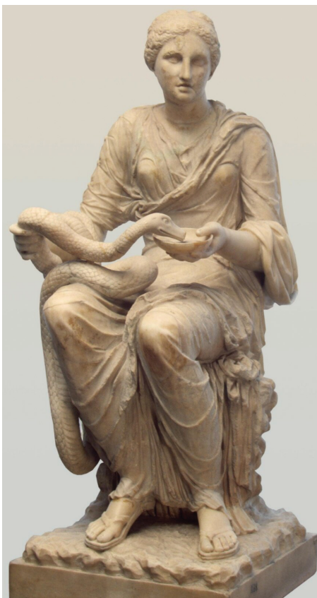
Древнегреческая богиня Гигея всегда изображалась в виде женщины, кормящей змею из чаши с молоком

Выдающимся представителем Книдской медицинской школы был Эврифон из Книды. Он был современником Гипократа, и многие учёные приписывают ему авторство отдельных трудов «Гипократова сборника». Эта школа продолжала традицию вавилонских и египетских врачей, развивала учение о признаках болезней